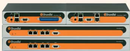
VoIP Call Center